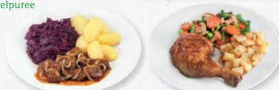
Runderhachee met rode kool en aardappelen